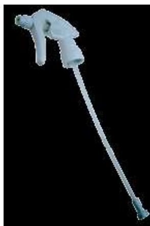
Szóróflakonok és fejek