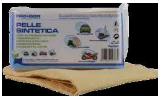
Autótörlőkendők, mikrokendők, mosószivacsok